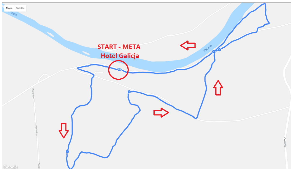
Fot. 1. Pętla wyścigu MTB (5 km)